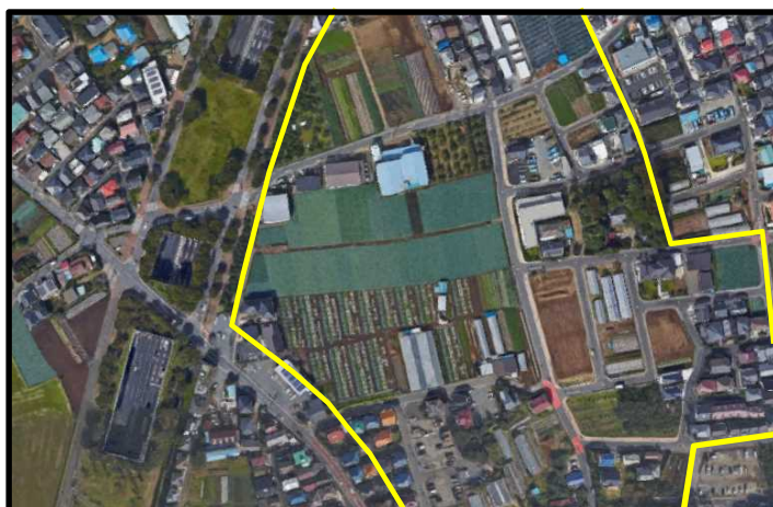
田園住居地域のイメージ